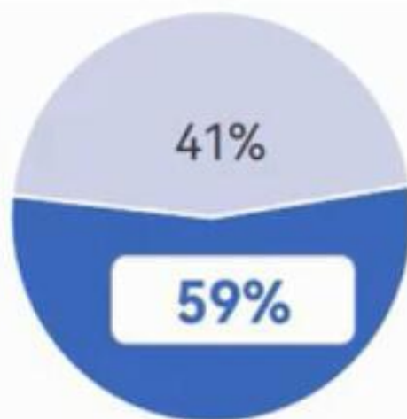
高职“双师型”占专任教师比