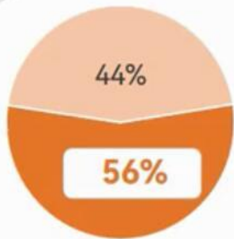
中职“双师型”占专任教师比

“双师型”比例： 从“双师型”教师在专业课教师中的占比看，均超过55%（中职56%、高职专科59%、高职本科59%），达到了占比过半的要求。