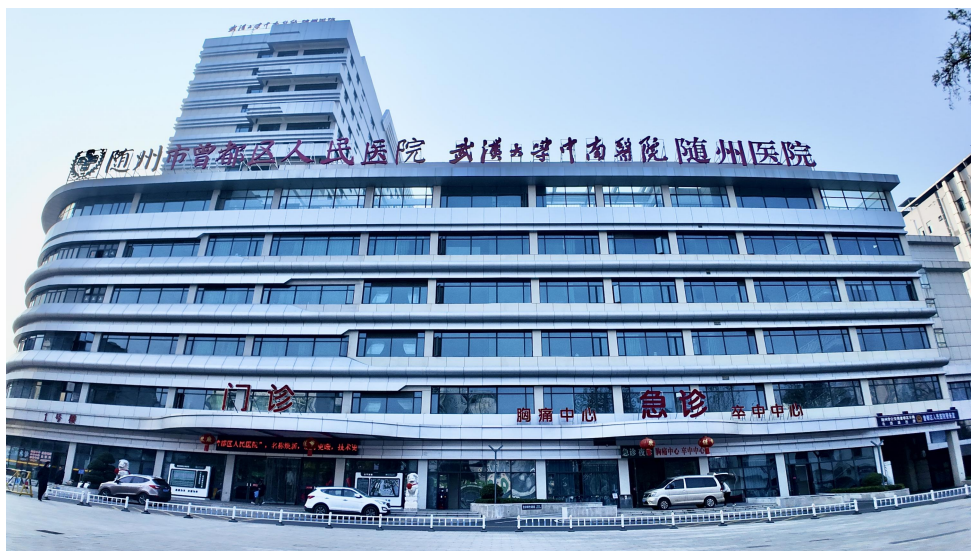
图1 随州市曾都区人民医院

随州市曾都区人民医院（武汉大学中南医院随州医院）创建于1952年，是一所集医疗、教学、科研、急救、康复、预防、保健于一体的三级乙等综合医院，位于随州市中心城区，由烈山大道主院区、解放路分院区及汉东名居门诊部组成，服务辐射人口260万。