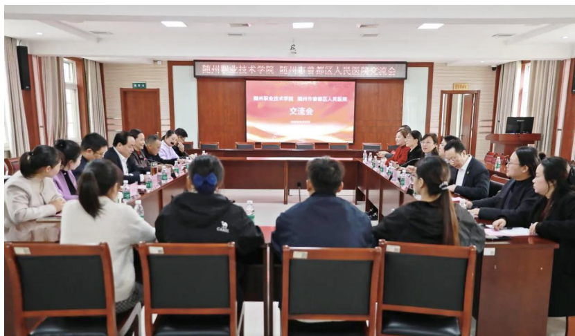
图 2 院校之间合作交流会