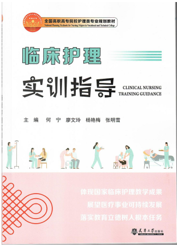
图 3 临床护理实训指导

教材建设注重反映学科前沿进展与临床实践需求，建立教材动态更新机制，及时将新技术、新指南、新规范纳入教学内容，确保知识体系的时代性与科学性。院校联合编写《临床护理实训指导》，对接临床前沿、体现岗位标准的精品课程与特色教材。实现理论与实践深度融合。依托数字教材平台，构建虚实结合的沉浸式学习环境，推动教材内容向可视化、交互化方向发展。通过三维解剖模型等数字化手段，增强学生的直观体验与动手能力。强化教材的临床适应性，融入典型病例分析与临床决策路径，提升学习的场景感与实用性。推进教材与临床真实场景深度融合，强化问题导向与决策训练，提升学生在复杂临床情境中的综合判断与应对能力。强化教材与“1+X”证书考核标准对接，实现学习成果与职业资格认证互认互通。